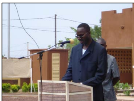
Le Ministre de la santé