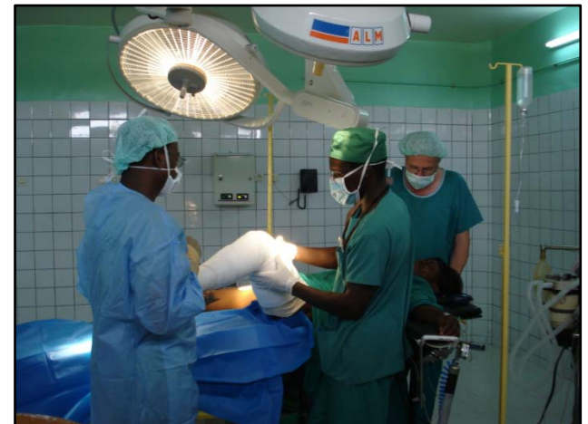
Allongement du tendon d'Achille