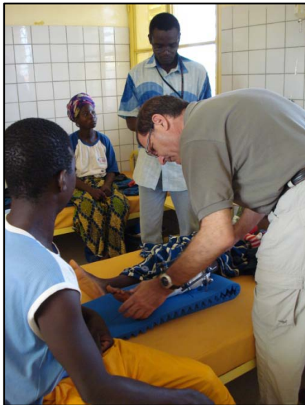
Visite aux malades